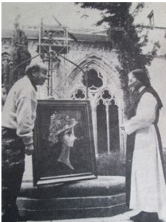
VALLBONA DE LES MONGES. L'artista fa donar un quadre per ajudar a la restauració de diferents parts del monestir.