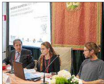
Els menorquins van viatjar fins a Galícia.

• Els Amics del Museu de Menorca van aprofitar la seva presència a la 37ena reunió d'associacions i gestors culturals organitzada per Hispania Nostra per posar sobre la taula la candidatura de la Menorca Talaiòtica a ser declarada Patrimoni Mundial per la Unesco. A la trobada també van participar els Amics de Punta Nati i la Fundació Lítica.