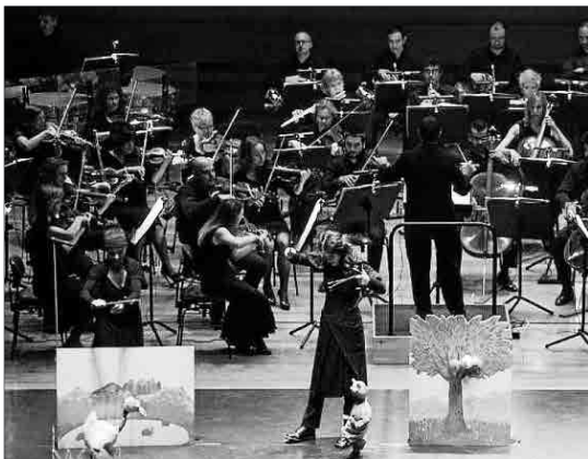
Imagen de una de las representaciones de Per Poc.

Se trata de la primera vez que la OCIM interpreta la conocida obra de Prokofiev, aunque ya cuenta con una dilatada experiencia en el campo de los conciertos pedagógicos. En esta ocasión, la orquesta contará con once músicos, dos violines, viola, violonchelo, contrabajo, flauta, oboe, clarinete, fagot, trompa y percusión, a las órdenes de un director. Además de las dos conciertos programados, el espectáculo hará al lunes siguiente en el Teatre Principal dos sesiones escolares con el aforo ya completo.