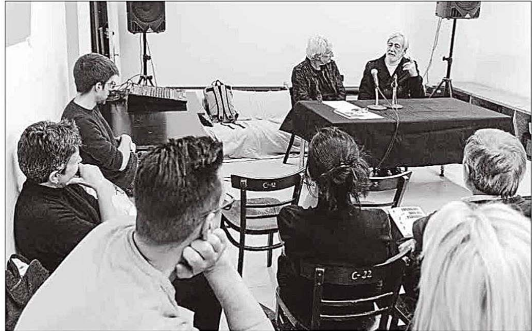
Imagen de la presentación de la novela, el viernes en el Espai Mallorca de Barcelona.

«La sociedad cambió rápidamente en los años 60 y 70 con la llegada del turismo de masas, las mujeres turistas eran, para los jóvenes, mucho más fáciles de abordar que las locales, surgió la figura del picador que las perseguía», indicó el menorquín, quien aclaró que «las hormigas en los pantalones, del título del libro, son una referencia al dicho inglés ants in their pants , que se usa para indicar un estado de nerviosismo, pero también es una referencia literal al picor dentro de los pantalones provocado