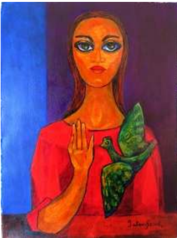
Noia amb colom. Tinta xinesa sobre paper-tela. Maties Palau Ferré. Col·lecció particular

En aquest marc, i tot i els anys passats des d'aleshores, és important garantir que els artistes disposin també avui d'una legislació que tingui en compte les peculiaritats del seu àmbit, i poder aprofundir en els seus drets laborals i intel·lectuals. Perquè l'art, per ser-ho, necessita també llibertat, a més de creativitat i inspiració. LT