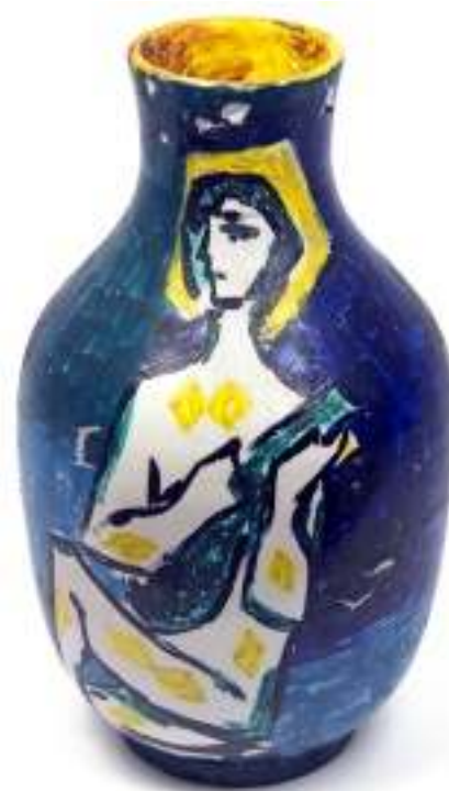
Arlequí . Ceràmica de Maties Palau Ferré. Col·lecció particular