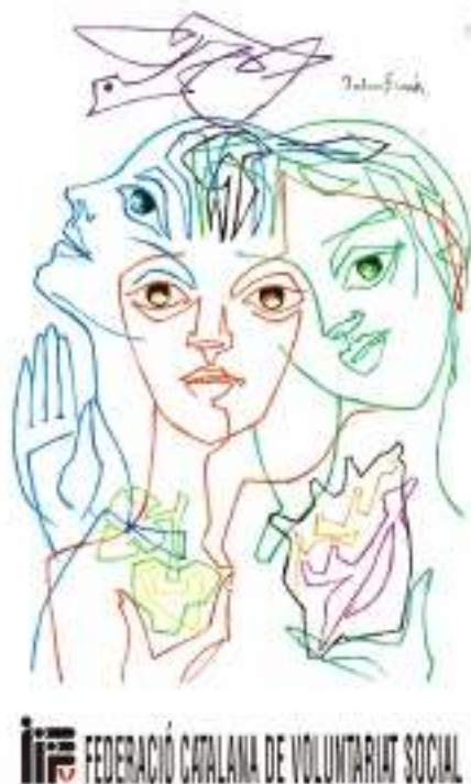
Cartell ideat per a la Federació Catalana de Voluntariat Social, 1989

La sentència no donava lloc a dubtes. Per acabar el contracte i desfer els lligams entre empresari i artista, al pintor